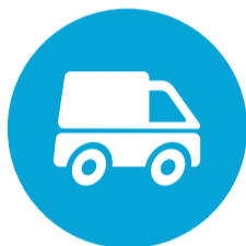
Mobiliteit en Transport (M&T)