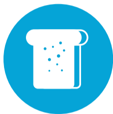
Horeca, Bakkerij en Recreatie (HBR)