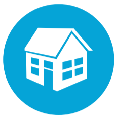
Bouwen, Wonen en Interieur (BWI)