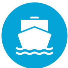
Maritiem en Techniek (MaT)