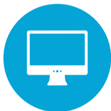
Media, Vormgeving en ICT (MVI)