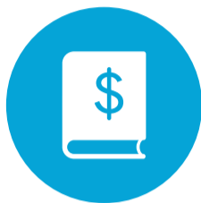
Economie en Ondernemen (E&O)