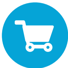
Dienstverlening en Producten (D&P)