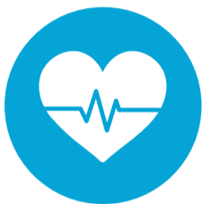
Zorg en Welzijn (Z&W)